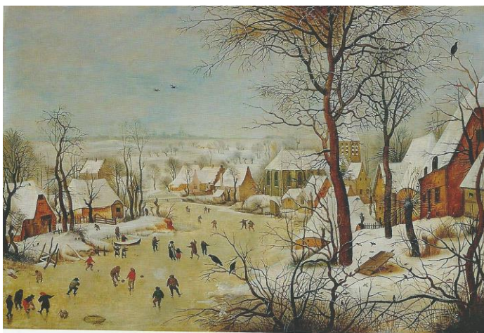
Le trébuchet aussi appelé paysage en hiver, Huile sur bois de chêne, 37 x 55,5 cm, 1565, Bruxelles, Musée royal des Beaux Arts

Le trébuchet, 1565. Pour les intéressés, le contenu de la conférence se trouve dans le livre présenté ci-dessus.